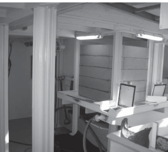
Arbejdsdækket på Carpe Diem bliver snart støjdæmpet med absorbenter.

Det vil derfor ikke hjælpe at støjdæmpe hjælpemotoren. I stedet bliver der sat støj-absorbenter op ude på shelterdækket. Og her til foråret skifter de kølekompres-