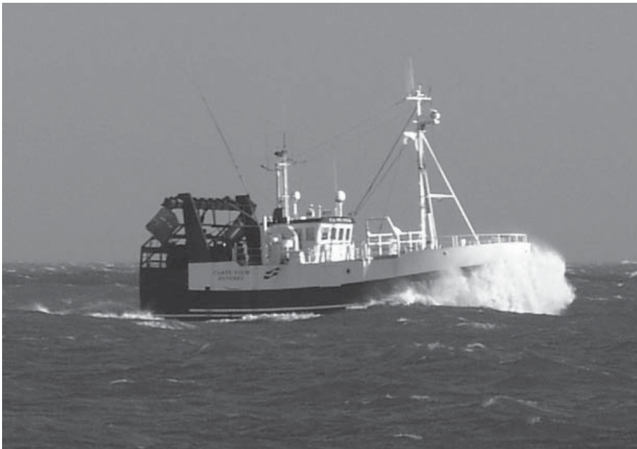
Carpe Diem er et monsterskib - både med hensyn til arbejdsmiljø, sikkerhed og sundhed.

soren. Næste gang de skifter hovedmotoren, vil de have den elastisk opstillet.